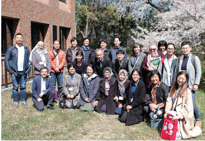
図3. トレーニングコースを終えて、桜満開の生理研にて