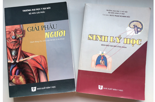
図2. ベトナムの教科書（GIẢI PHẪU NGƯỜI：人体解剖学，SINH LÝ HỌC：生理学）

への進学率はほぼ100%です。地方都市や農村部などで高校進学率が低い地域もありますが、これは経済的な事情で職業訓練のための専門学校に進学する人が多いからです。